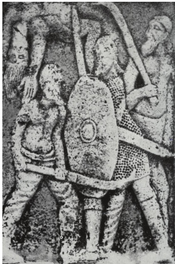
Fig. 2. Metopa de Adamklissi. Muestra guerreros dacios armados con las temibles falces y un soldado con cota de malla, espada larga, casco, y escudo dacio (En LAGO, J. I., Opus cit. , p. 69).

Se trataba de infantería ligera, aunque sus temibles armas la conferían una potencia de choque tremenda, capaz de abrirse paso entre las filas romanas,