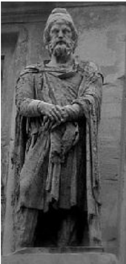
Fig. 1. Guerrero dacio en el Arco de Constantino procedente del Foro de Trajano (Autor: Zanner).

La imagen más conocida de los guerreros dacios es la que ilustra la Columna Trajana 7 , hombres vestidos con un sencillo pantalón largo, un gorro puntiagudo y armados de las temibles falces, “espadas curvas” de aproximadamente un metro de longitud con una hoja curva que, manejadas con ambas manos, eran capaces de cortar un brazo o una pierna limpiamente 8 .