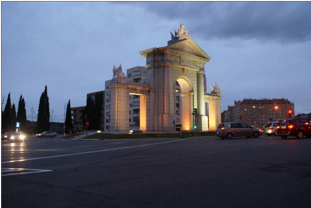
Puerta de San Vicente en el paseo de la Florida

Se trata de un mensaje con el que se conmemora la inauguración de la puerta y que evidencia y ensalza el poder de Carlos III. A pesar de su latín de reminiscencias clásicas, el epígrafe encaja a la perfección en la concepción ilustrada de la “utilidad pública” como objetivo de la acción política 3 : gracias a la voluntad regia se construye la puerta y se adecúa un camino en el que se enmarca este arco monumental. No hay que olvidar que la puerta formaba parte del proyecto de embellecimiento de la zona del paseo de la Florida y la cuesta de San Vicente y, por ello, la inscripción se refiere al camino habilitado para conectar estas vías.